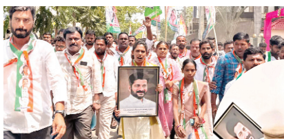
గజ్వెల్ (సిద్దిపేట జిల్లా), ఆంధ్రప్రదేశ్ : మాజీ సీఎం, ప్రతిపక్షనేత, బీఆర్ఎస్ అధ్యక్షుడు కె.పం. ద్రోణి రావు (కేసీఆర్) క్యాంప్

అయినా ముట్టడించి, కార్యాలయంలో సీఎం రేవంత్ రెడ్డి ఫోటో ఏర్పాటు చేయడంతో ఉద్రిక్తత పరిస్థితులు చోటుచేసుకున్నాయి. కేసీఆర్ ప్రాతినిధ్యం వహిస్తున్న గజ్వెల్ నియోజకవర్గం ప్రజలకు అందుబాటులోకి రావాలని కాంగ్రెస్ శ్రేణులు డిమాండ్ చేశారు. శనివారం ఉదయం గజ్వెల్ లో ప్రజలలోని అంజనేయి చొరస్తూ నుంచి కాంగ్రెస్ శ్రేణులు పెద్ద ఎత్తున కేసీఆర్ క్యాంప్ కార్యాలయం వద్దకు ర్యాలీగా చేరుకున్నారు. ఉదయం పదకొండు > 2వ పేజీలో..